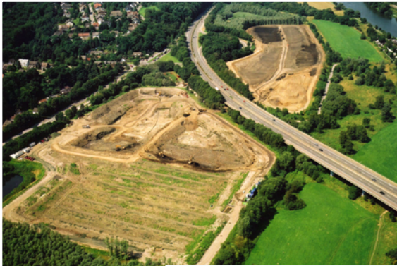
Vorarbeiten zum Bau der Kläranlage Essen-Süd: Sedimentumlagerung auf den Spülfeldern an der Wuppertaler Straße

Um mit dem Bau der Kläranlage Essen-Süd im ehemaligen Spülfeld Süd, das 1983 für die Ausbaggerung des Baldeneysees angelegt wurde, beginnen zu können, waren umfangreiche Vorarbeiten erforderlich. Als erste Maßnahme wurde das Baufeld, das etwa zwei Drittel des Spülfeldes Süd umfasst, mit einer bis in den wasserundurchlässigen Fels hinreichenden Dichtwand mit 60 cm Stärke und einer maximalen Tiefe von 17,50 m umschlossen. Der so gebildete „Topf“ ermöglicht es, dass der Grundwasserstand auch bei Hochwasser der Ruhr auf dem erforderlichen Niveau gehalten werden kann. Als nächster Schritt konnten dann die abgelaugten Spülsedimente entnommen und im Spülfeld Nord wieder eingebaut werden. Dazu wurden insgesamt rd. 400.000 m 3 Boden bewegt.